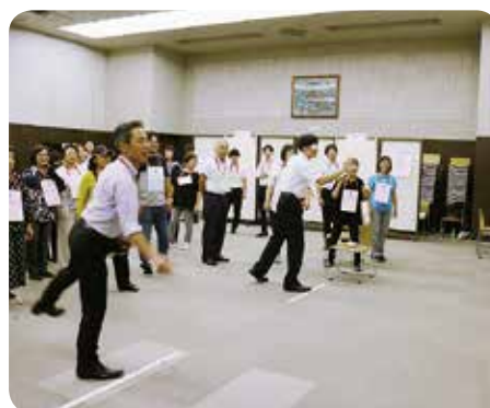
盛り上がった風船ダーツ

誰でも気軽に行える競技の為、各チーム大いに盛り上がり、スポーツを通じて交流を深めることが出来ました。