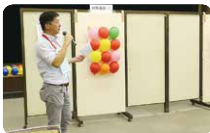
菱田副委員長による競技説明