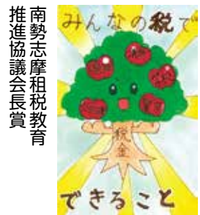
南勢志摩租税教育推進協議会長賞