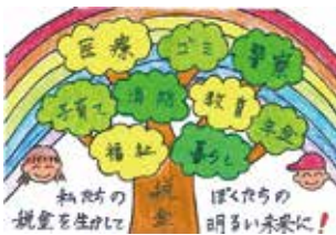
伊勢税務連絡協議会長賞